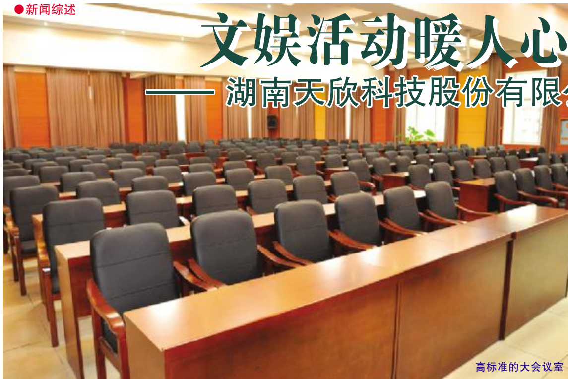
高标准的大会议室

企业是树,文化是根,根深才能叶茂。按照《湖南天欣集团文化建设发展纲要》的总体要求,天欣科技在企业文化建设中,注重加强企业文化的目标性、系统性和全面性,注重成果的转化,在凝聚人心、促进发展、强化管控、提升效益、优化形象等方面取得了良好的成效。